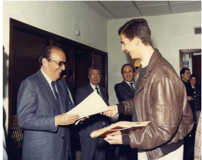
INE enero 1989. Madrid. Cercanía y complicidad entre las partes...

La competencia como docente del profesor Enrique Fuentes Quintana es reiterada y públicamente reconocida, llegando a ser elegido preceptor del Príncipe Felipe de Borbón en sus estudios universitarios; programas, lecciones y recomendaciones de los cursos 1988 a 1992, conservadas en este legado, ponen de manifiesto su vinculación y afecto mutuo. Cuando en 1989 es galardonado con el Premio Príncipe de Asturias, entre los telegramas de felicitación enviados desde la Zarzuela, el de don Felipe concluye “ Con el mayor afecto ”.