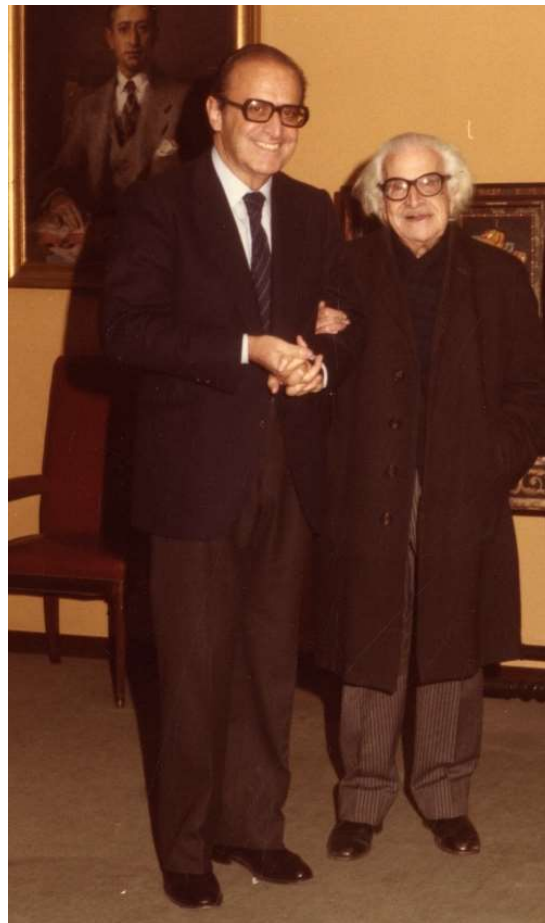
Homenaje a Ramón Carande, Sevilla, diciembre de 1984

Muchas son las imágenes que se podrían destacar y en las que se dan cita algunos de los más ilustres personajes de la vida política y cultural española de la segunda mitad del s. XX, incluida la familia real, pero de entre todas hemos querido destacar la de otro ilustre paisano y amigo de Enrique Fuentes Quintana y, por añadidura, también Premio Príncipe de Asturias de la Ciencias Sociales en 1985: don Ramón Carande Tovar . De su aprecio y admiración mutua da cuenta su correspondencia. Además de la procedencia compartían su amor por el conocimiento, por la docencia y por el trabajo bien hecho.