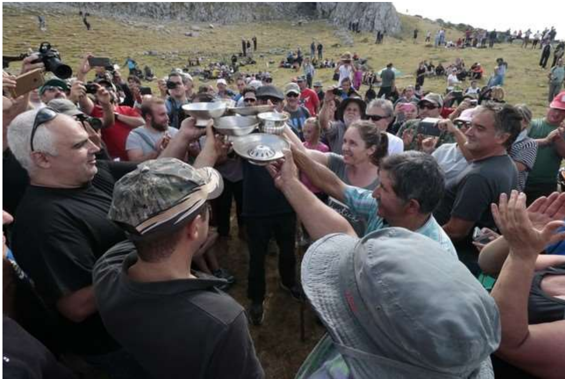
Mojonera 2018. Diario Palentino digital, 9 sep. 2018.