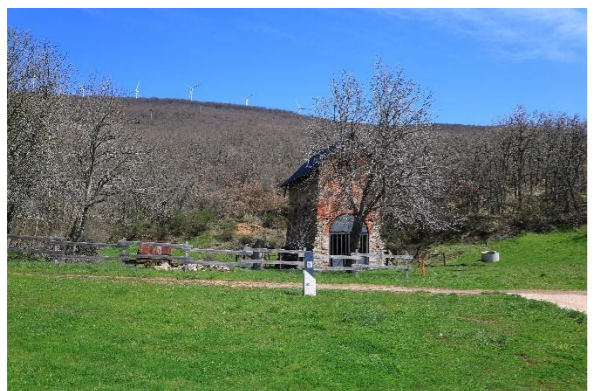
Pozo Rafael, Bocamina San Ignacio y Central Eléctrica – Vallejo de Orbó