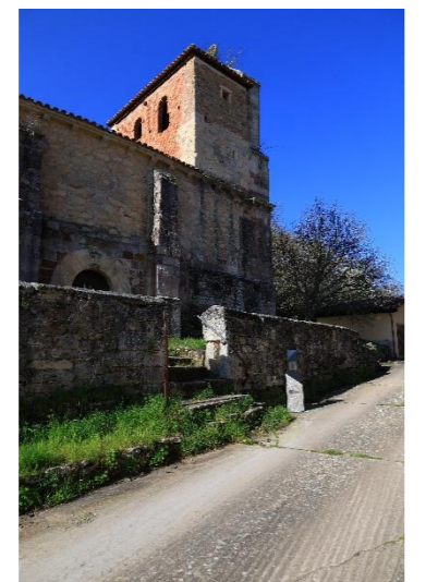
San Pedro - Becerril