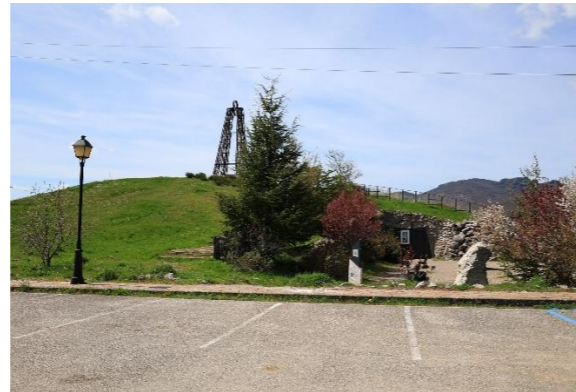
Mina visitable – Barruelo de Santullán