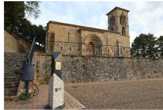
Santa Cecilia – Aguilar de Campo