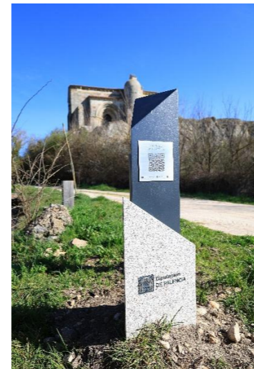
Santa Cecilia - Vallespinoso