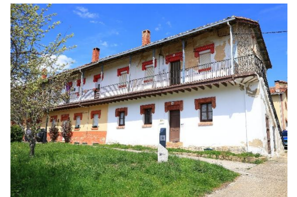
Vivienda minera – Vallejo de Orbó