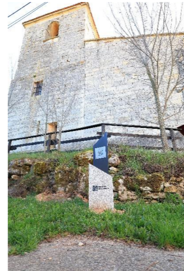
San Fructuoso – Colmenares