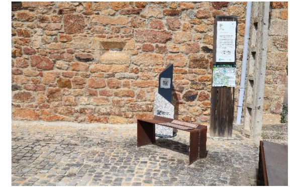
Santa María - Villamayor