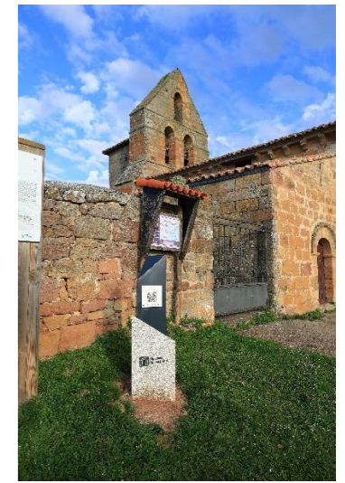
San Andrés - Matabuena