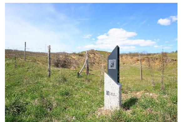
Salida Canal Calero Lavadero – Vallejo de Orbó