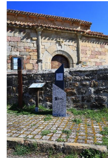
San Cornelio y San Cipriano – Revilla