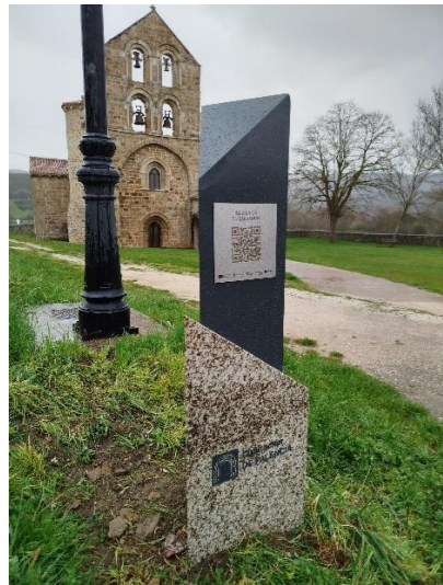
San Salvador - Cantamuda