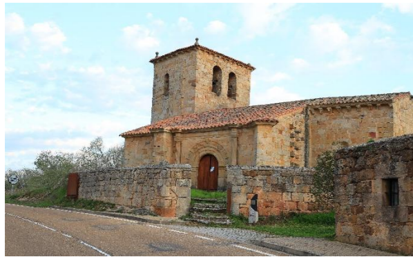
Santiago - Cezura