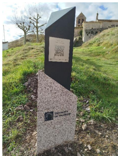
Santa María – Becerril