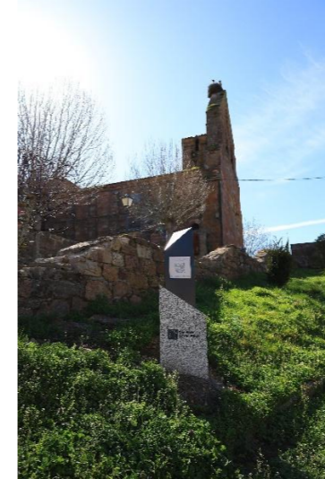
San Cornelio y San Cipriano – San Cebrián de Mudá