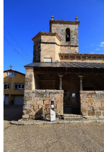
San Salvador - Pozancos