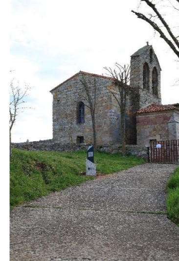
San Esteban - Lomilla