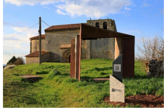
San Martín - Matalbaniega