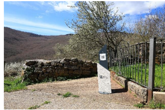
Santa Eulalia - Brañosera