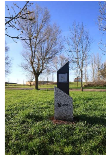
La Asunción – Pisón