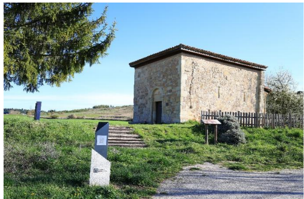
San Pelayo - Perazancas