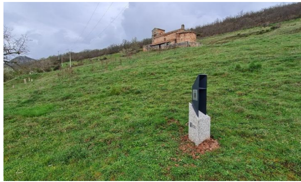
Santa Marina – Villanueva de la Torre