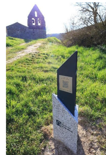
Nuestra Señora – Valdegama