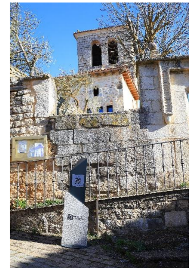
La Asunción – Perazancas