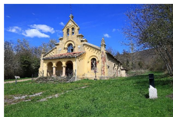
Hospital Cine Iglesia – Vallejo de Orbó