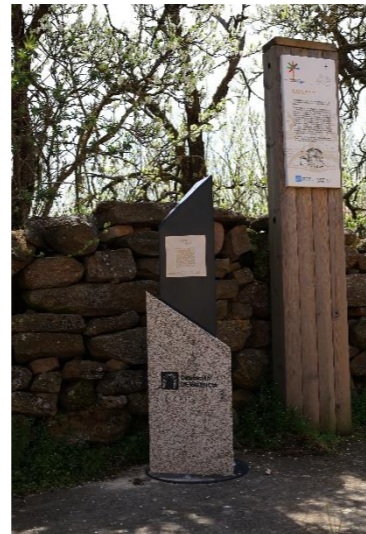
San Juan – Villavega de Aguilar