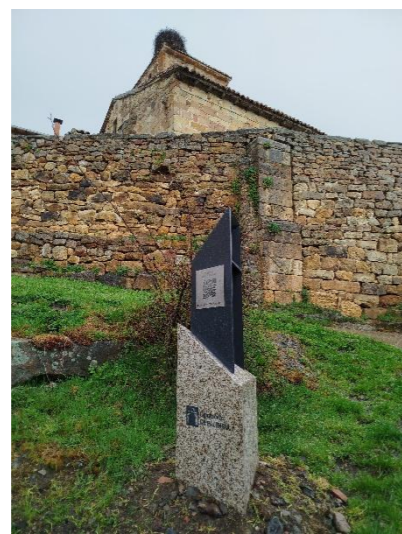
Santa Eulalia – Celada