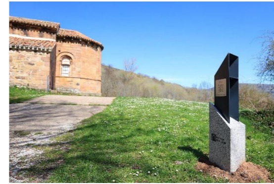
Santa María – Valberzoso