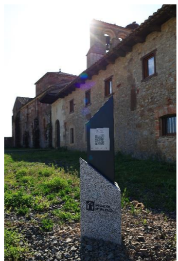
Santa María - Mave