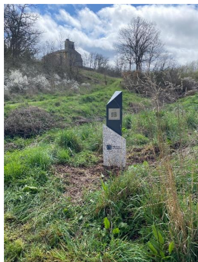
San Juan - Matamorisca