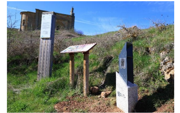
Santa Eulalia – Barrio de Santa María