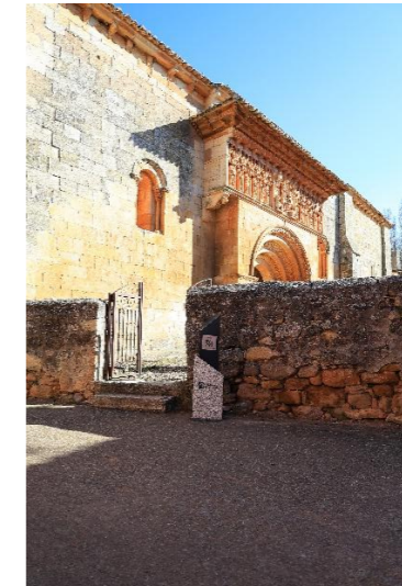
San Juan - Moarves