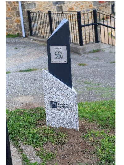
San Andrés – Cabria