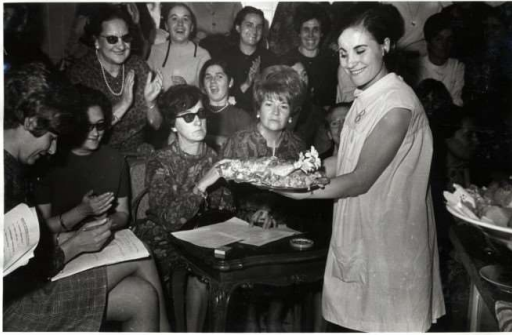
Curso de Cocina en Palencia?. 1969