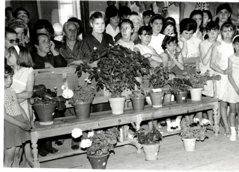
Concurso de floricultura en Población de Campos