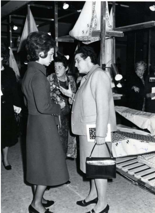
Con la princesa Sofía, al fondo Pilar Primo de Rivera, en las Jornadas sobre Mujer y Trabajo. 1975

Su importancia y méritos dentro de la S.F. se constata con las más altas distinciones de las "Y" de Oro y Plata de la SF y otras condecoraciones de distintas instituciones franquistas, algunas muy tempranamente como la del Ministerio de Agricultura ya en 1946, o la Gran Cruz de la Orden de Cisneros al Mérito Político.