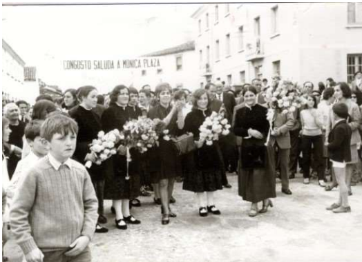
Homenajes y recepciones 14