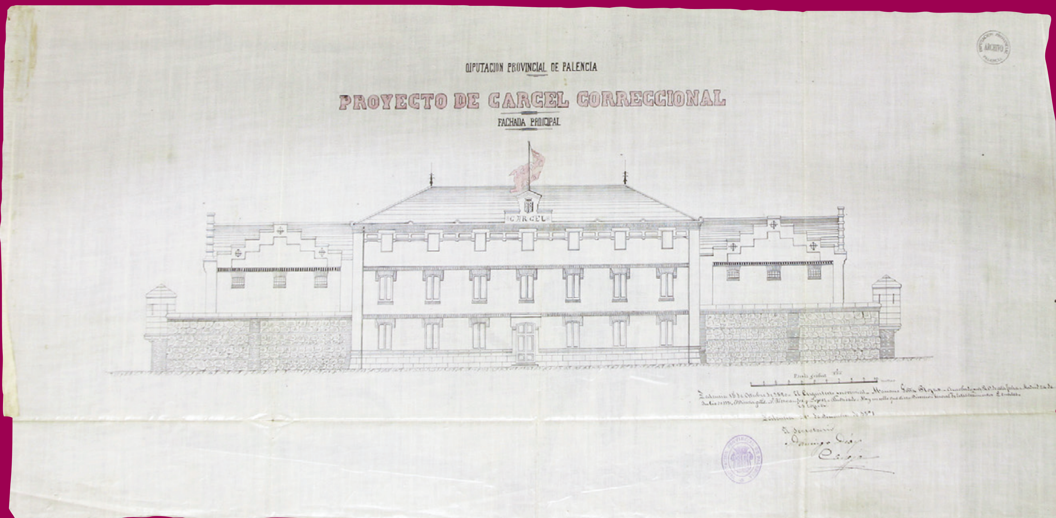
1890 Proyecto de edificación de Cárcel Correccional en Palencia. Arquitecto Provincial: Mariano González Rojas. Plano fachada principal. Copia de 1891. ADPP C-1746