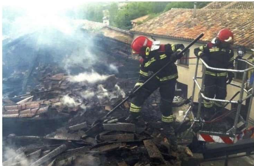
Imagen de archivo de una intervención de los bomberos voluntarios de la Diputación en un pueblo del norte de la provincia.

Al tratarse de un servicio profesional que comienza desde cero, aún está por decidir cuál será su destino, si bien según la convocatoria los parques inicialmente previstos para el desempeño de sus funciones serían los de Palencia, Aguilar de Campoo y Saldaña. También se desconoce, al menos de