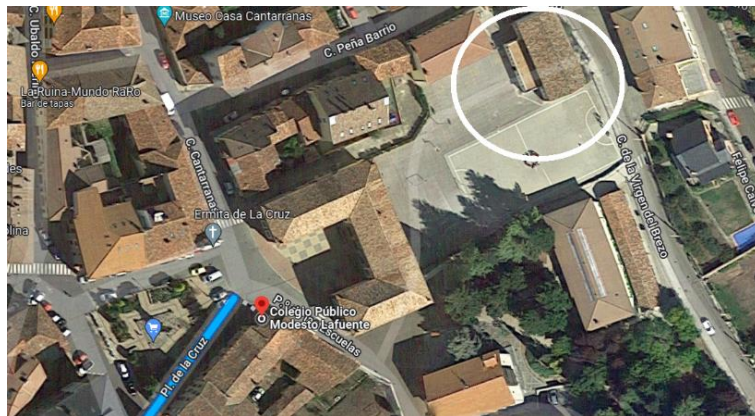
Anexo 2: Ubicación Campo de la Juventud, Palencia.