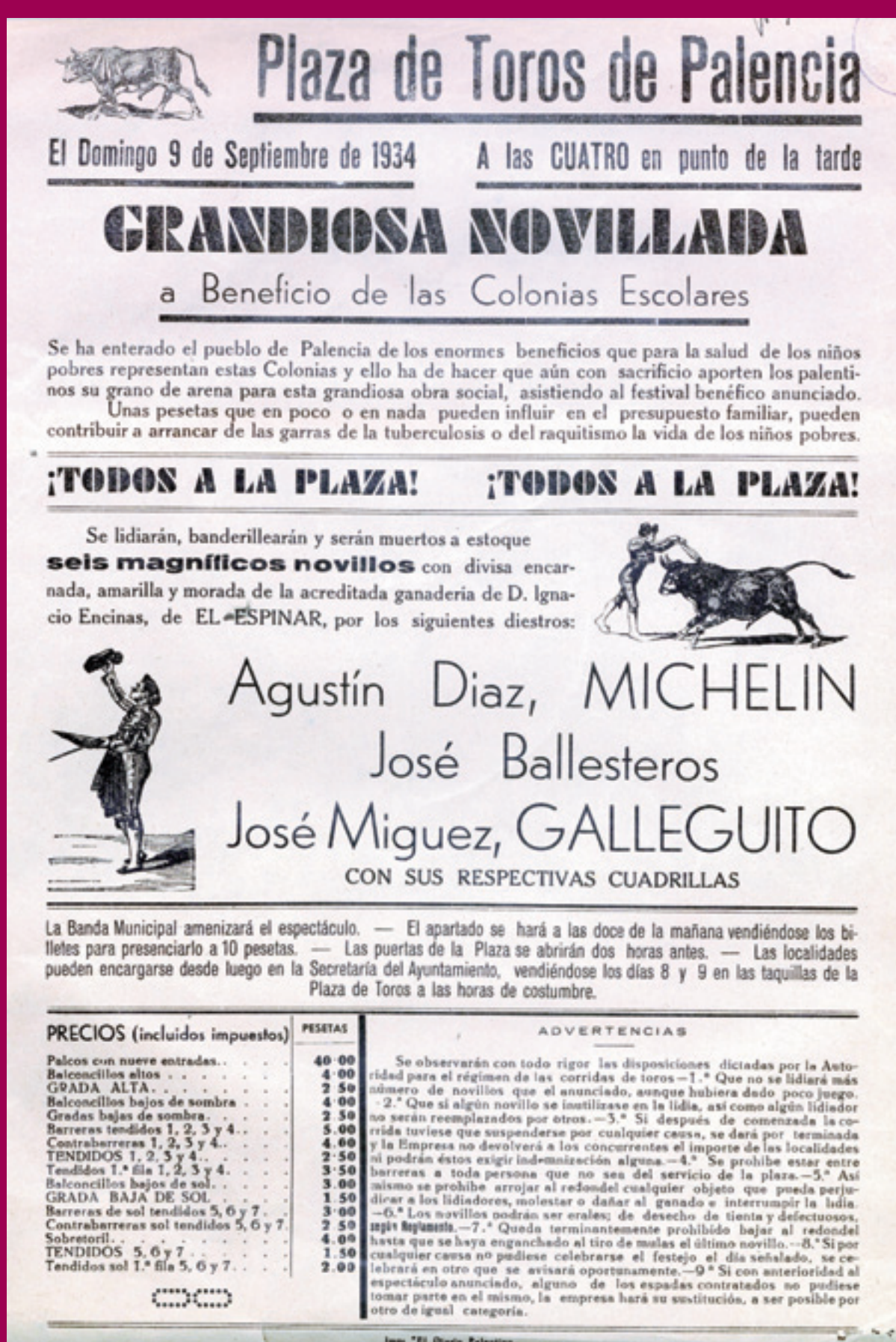
1934 Grandiosa novillada a beneficio de las Colonias Escolares (material gráfico): Plaza de Toros de Palencia... 9 de septiembre de 1934. — [S.l. : s.n., 1934] (Imp. "El Diario Palentino"). ADPP (BTM)