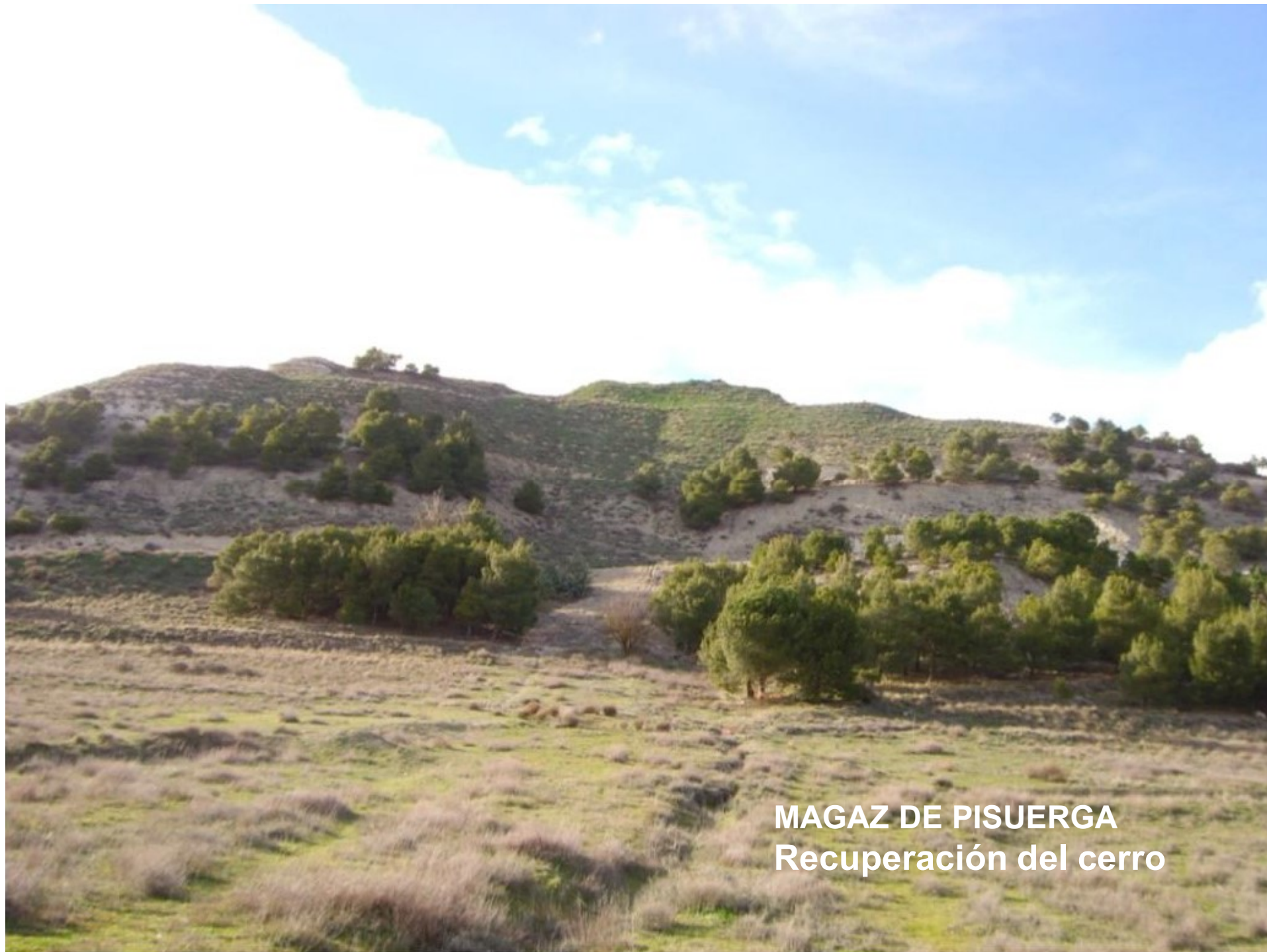
MAGAZ DE PISUERGA Recuperación del cerro