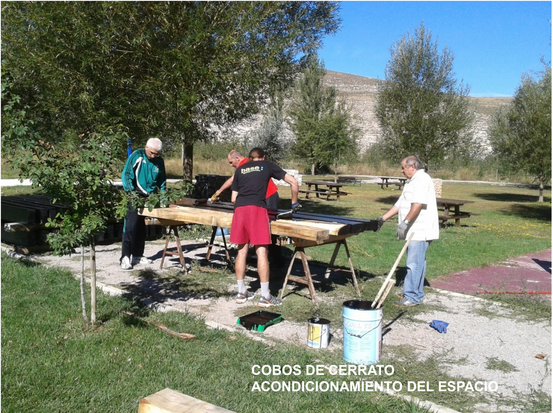
COBOS DE CERRATO ACONDICIONAMIENTO DEL ESPACIO