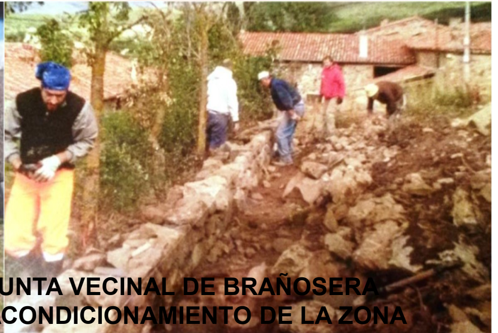
JUNTA VECINAL DE BRAÑOSERA ACONDICIONAMIENTO DE LA ZONA