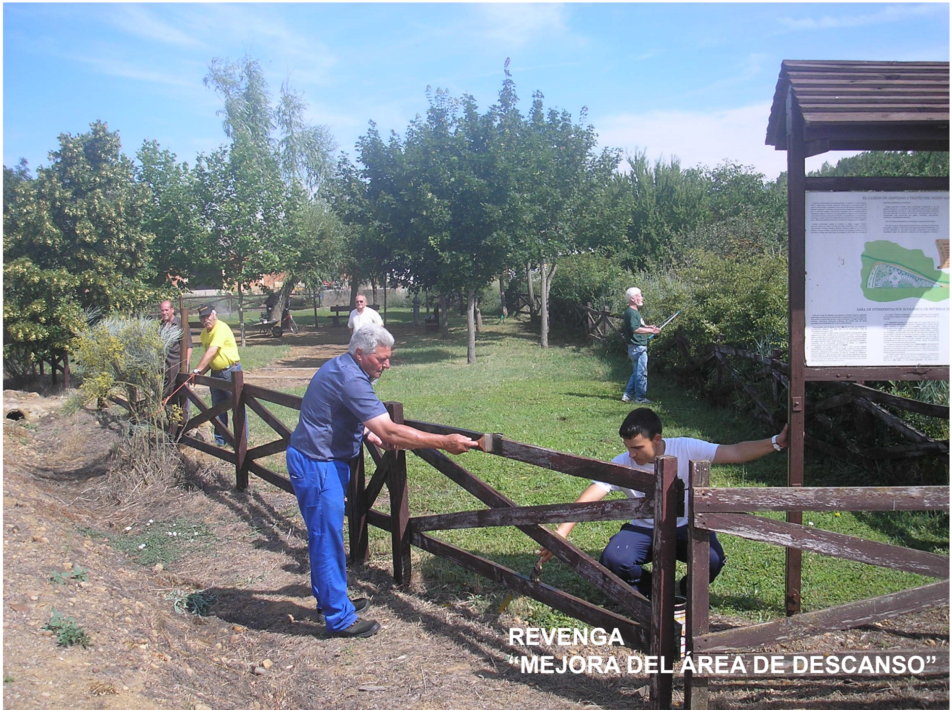
REVENGA “MEJORA DEL AREA DE DESCANSO”