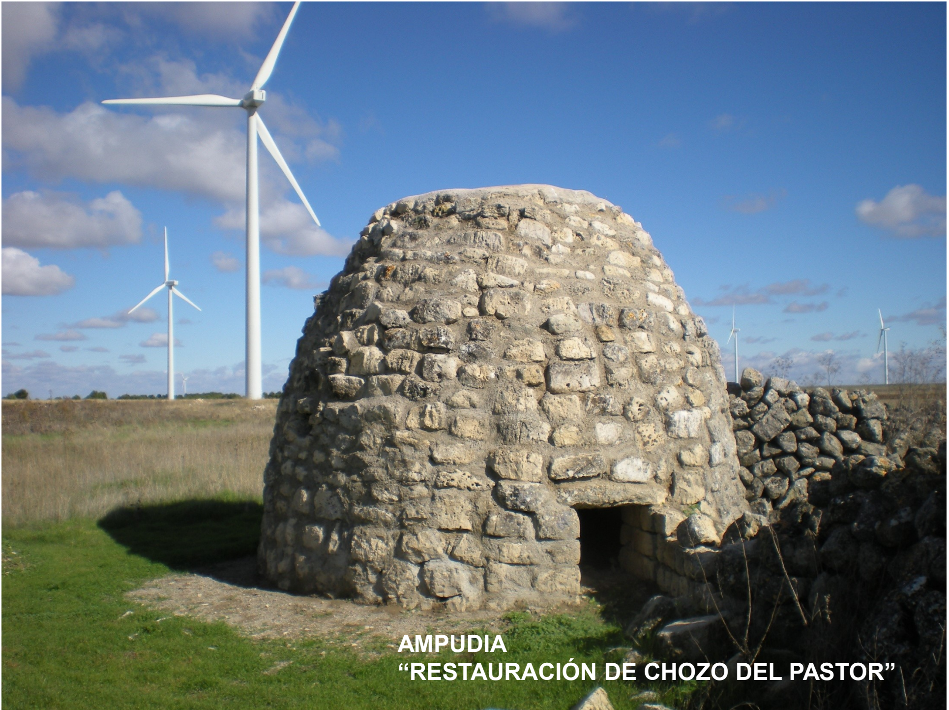
AMPUDIA “RESTAURACIÓN DE CHOZO DEL PASTOR”