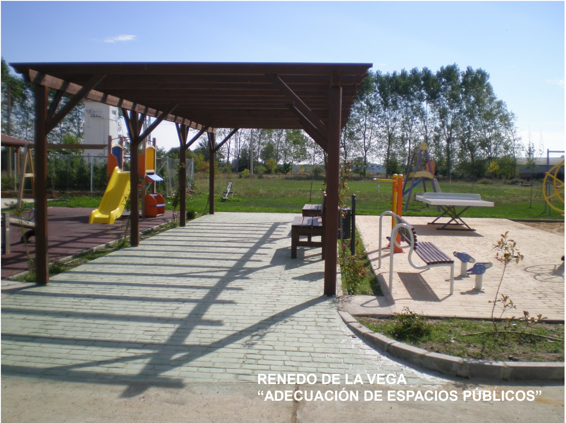
RENEDO DE LA VEGA “ADECUACIÓN DE ESPACIOS PÚBLICOS”