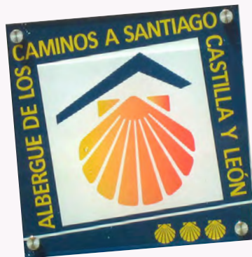
Albergue de peregrinos.