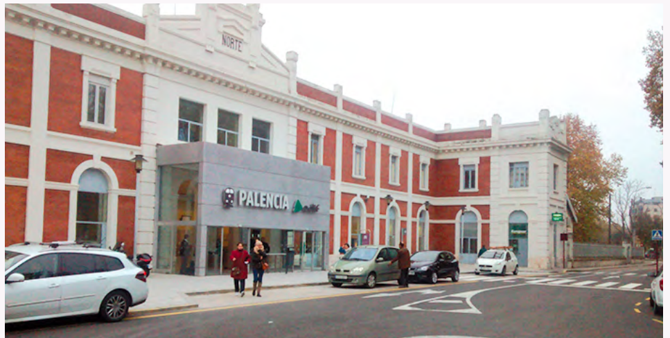
Estación del AVE de Palencia

Lema «Postales con sabor rural». www.palencia21rural.com