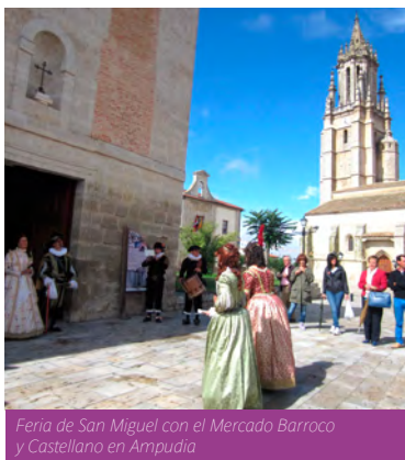
Feria de San Miguel con el Mercado Barroco y Castellano en Ampudia