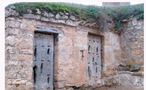
Barrio de bodegas. Baltanás.

tividad y de pertenencia de la comarca del Cerrato palentino ya que responden a un proceso histórico y de aprovechamiento de los recursos del territorio asociado a los sistemas productivos de la viña y de su transformación y crianza del vino.