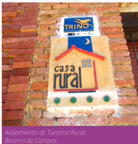
Alojamiento de Turismo Rural. Becerril de Campos.

A raíz de la normativa regional, sobre la regulación de los establecimientos de turismo rural, la administración estableció la fecha del 3 de marzo de 2015 a los establecimientos como límite para adaptarse a la nueva categorización. Ante la escasa concurrencia de las empresas de alojamiento para acomodarse a las normas, la Junta de Castilla y León se ha visto obligada a ampliar el plazo hasta el próximo 21 de diciembre. Con esta reglamentación, continuarán como alojamientos en el medio rural las Casas de Turismo Rural y las Posadas, mientras que, los Centros de Turismo Rural se transformarán en Hotel Rural. Además, se sustituye la marca de calidad de clasificación con «Espigas», creada por la Asociación Española de Turismo Rural (Asetur), por el sistema de las «Estrellas Verdes» en función de los servicios y las características de cada alojamiento.