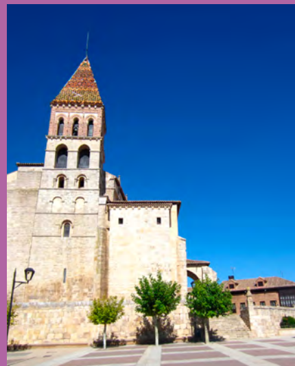
Iglesia de Santa Eulalia. Paredes de Nava.