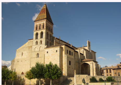
Paredes de Nava

El consistorio paredaño ha presentado el plan «Estrategia de turismo cultural», compuesto por cuatro líneas estratégicas, con el objetivo de restaurar el patrimonio arquitectónico de la localidad. La primera línea de actuación va a consistir en la renovación del edificio del Ayuntamiento, un antiguo monasterio desaprovechado, donde van hacer el seguimiento los egresados en Arquitectura de la Universidad de Catalonia (Italia). El segundo proyecto, interrelacionado con la anterior medida, va a ser la consideración de todo el municipio como un «museo abierto» como vía de refuerzo de la identidad local. Otra de las iniciativas, es el proyecto piloto «Escuela de patrimonio de verano» (Heritage Summer School) con el objetivos de pensar el espacio público de manera colaborativa. Finalmente, la rehabilitación del Convento de San Francisco y conversión de la iglesia en Centro de Artes Escénicas. La puesta en marcha de esta estrategia debe erigirse en el motor de desarrollo económico del municipio con repercusiones directas en la hostelería, la restauración y en otras ramas turísticas.