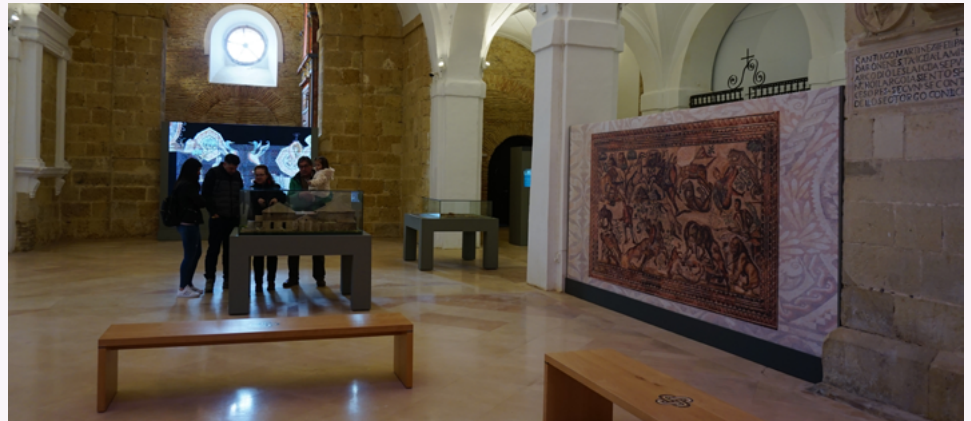
Museo de La Olmeda. Saldaña.

DECRETO 22/2018, de 26 de julio, por el que se regulan los establecimientos de alojamiento en la modalidad de albergue en régimen turístico en la Comunidad de Castilla y León (BOC y L nº 146, de 30 de julio de 2018).