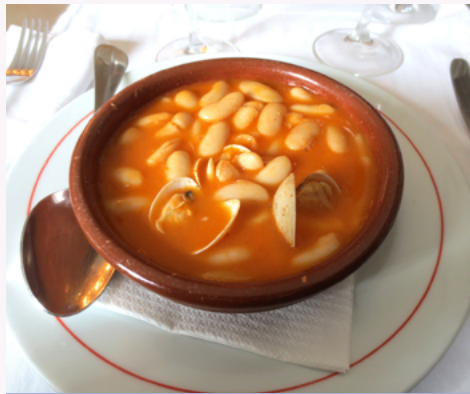
Alubias de la Puebla variedad fabada con almejas

Con la llegada del nuevo año, se han dado algunas modificaciones en la oferta de las infraestructuras y los servicios turísticos de cara a cubrir el potencial incremento de la demanda de los visitantes. Por este motivo, los cambios producidos en la planta alojativa han sido la disposición de un nuevo hostel, el cierre de una casa rural y la apertura de dos hoteles rurales y, en la rama de los establecimientos de restauración, por diversos motivos se redujeron los salones de comidas y plazas. Por tanto, los alojamientos hoteleros ascendieron a 119 establecimientos con 3.798 camas, que según categorías, suponen 34 hoteles con 2.180 camas, 62 hostales con 1.354 camas y 23 pensiones con 264 camas. Mientras que, la red de alojamientos de turismo rural ascendió a 241 inmuebles y 2.182 plazas repartidos en 5 casas rurales de alojamiento compartido con 48 plazas, 194 casas rurales de alquiler con 1.336 plazas, 35 hoteles rurales con 619 plazas y 7 posadas con 179 plazas. En el apartado de los alojamientos extrahoteleros, se ha dispuesto de cuatro campamentos de turismo, 34 albergues con 1.341 plazas, 14 viviendas de uso turístico con 85 plazas y 11 apartamentos turísticos con 209 plazas. En lo que respecta a los restaurantes, se ha ofrecido el servicio de comidas a través de 344 comedores para 30.709 cubiertos.