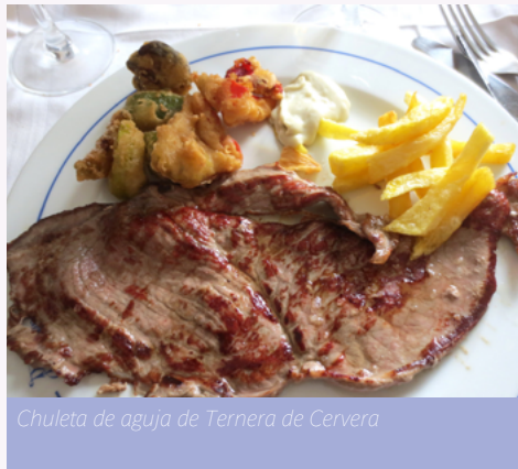
Chuleta de aguja de Ternera de Cervera