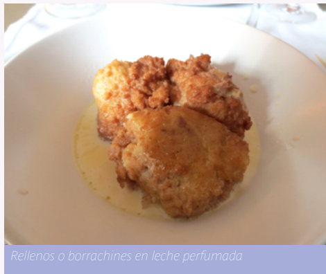
Rellenos o borrachines en leche perfumada