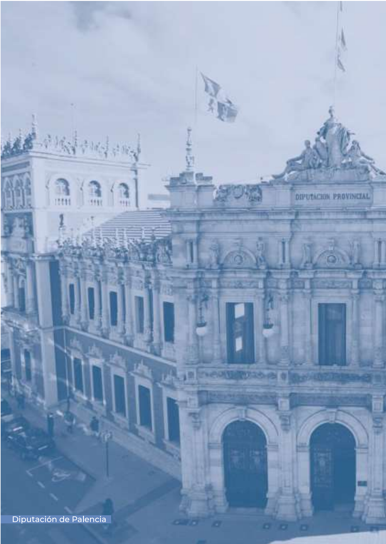
Diputación de Palencia