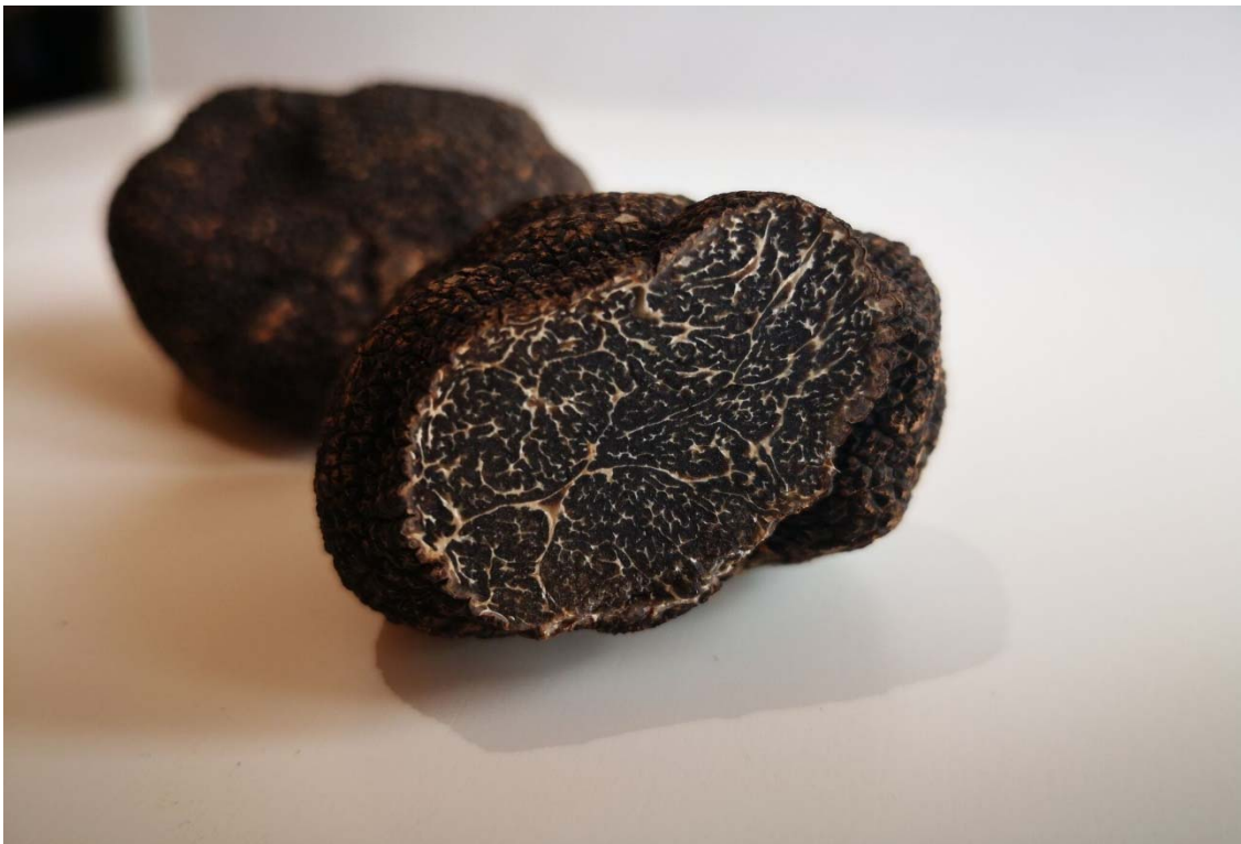
Imagen 1. Foto detalle de la trufa negra ( Tuber melanosporum Vittad)

En él se presentan una serie de conocimientos básicos y necesarios para el desarrollo de las actividades que tienen que ver con plantaciones truferas tan importantes como: la selección de tierras, las labores para el establecimiento, el manejo y la gestión de la plantación. También se exponen algunos avances tanto en las técnicas agrícolas para un adecuado establecimiento, como en lo relacionado con la aplicación de esporas y bacterias asociadas con el cultivo, que ayudan a mejorar y aumentar la producción. Por último, se pueden ver algunos datos de interés para la distribución y comercialización en los mercados existentes y un breve estudio de viabilidad de una plantación tipo.