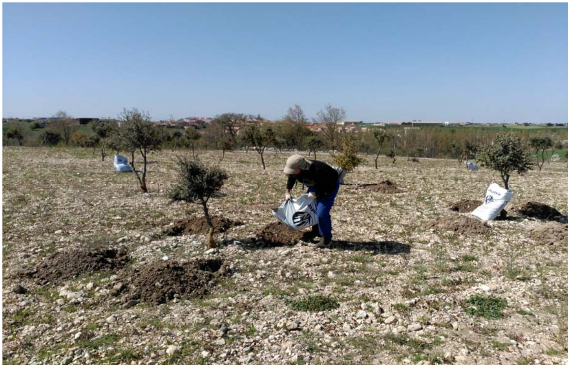
Imagen 10. Aporte de sustrato. Nidos truferos.

El momento óptimo para hacer los nidos es tras finalizar la temporada de recolección, empezándose a partir del 4 año y con una frecuencia cada tres años. A partir del año 20, los nidos pueden hacerse cada 4 años ya que en ese momento habrá una cantidad de materia orgánica suficiente en el suelo.