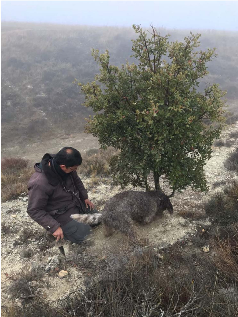
Imagen 11. Recogida de trufas en el cerrato palentino.

No siempre las trufas se encuentran cerca de la superficie por lo cual alguna vez habrá que escarbar hasta llegar a ella. Imprescindible será siempre tapar el hoyo que se ha hecho, con el fin de conservar las condiciones del suelo.