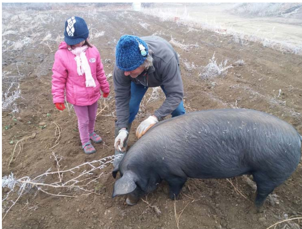
Imagen 13. Golosa, hembra de cerdo ibérico entrenada para coger trufas en Palencia.