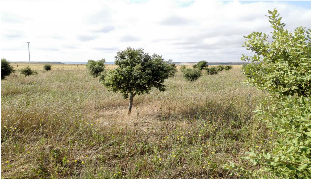
Imagen 7. Trufera con necesidad de poda (Villaviudas-Palencia).