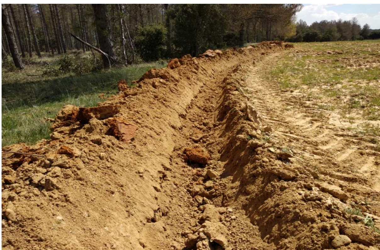
Imagen 3. Zanja de prevención de contaminación de parcelas linderas a la plantación.