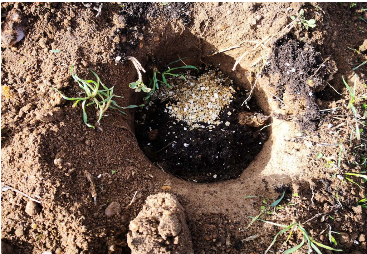
Imagen 4. Hoyo de plantación con aporte de sustrato e inoculo extra de trufa.

En caso de que el suelo esté muy seco en el momento de la plantación, es importante realizar un primer riego en el menor tiempo posible, para asegurar el éxito del establecimiento de la planta.