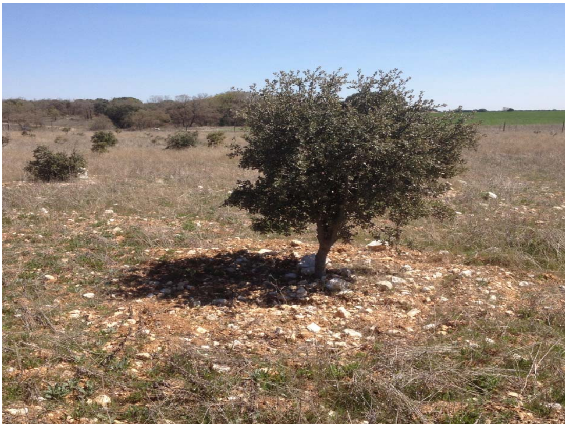
Imagen 2. Plantación de trufa negra con encina en la zona del Cerrato palentino (Palencia).

Por último, recalcar que paradójicamente, las plantaciones truferas están siendo rentables, a pesar de estar establecidas en suelos pedregosos y pobres. Es importante resaltar que el éxito en este cultivo se alcanza siempre que se tengan en cuenta todos y cada uno de los requisitos que se explican de manera detallada en este manual. Las distintas experiencias demuestran que si se desprecia alguno de ellos puede llevar al traste la explotación y por lo tanto la inversión.