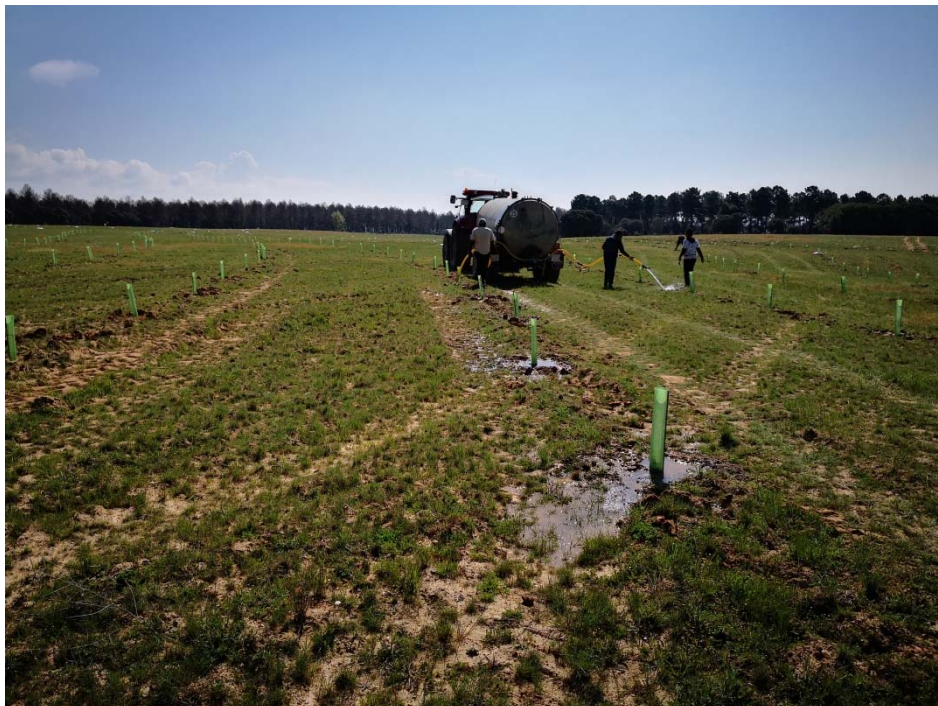
Imagen 8. Riego de apoyo.

Una vez que empiezan a formarse los primordios (abril-mayo), se requiere una cierta humedad en el suelo para no perjudicar el desarrollo de las trufas, aportado en forma de lluvia o mediante riegos esporádicos.