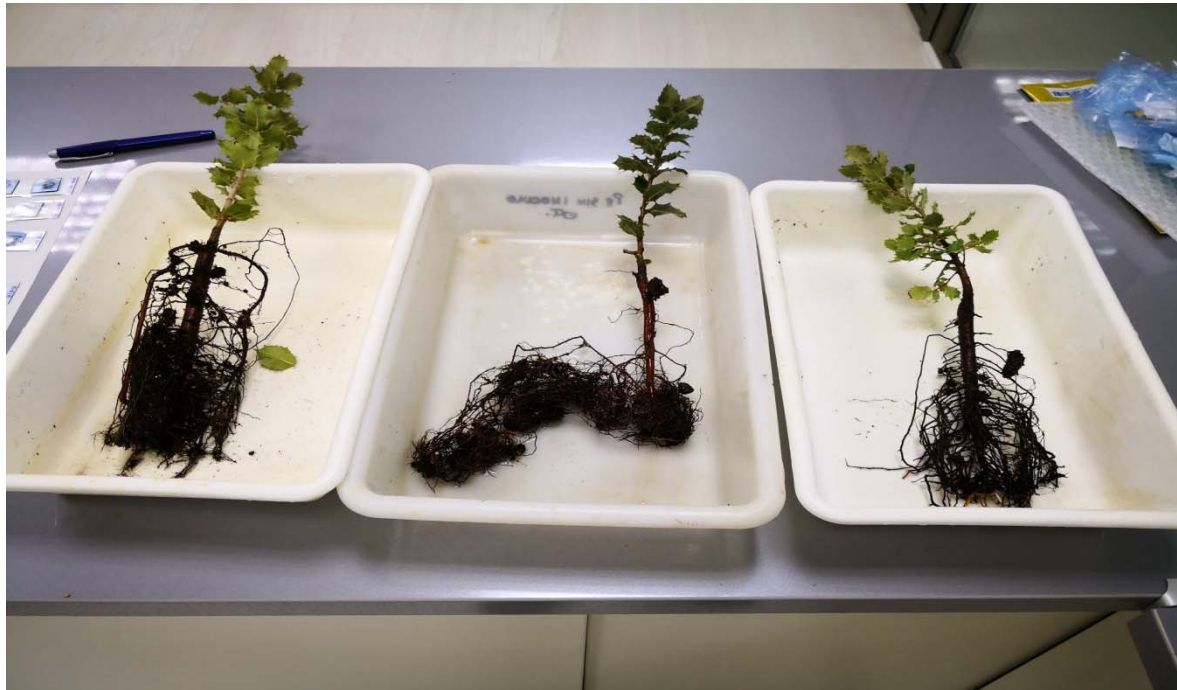
Imagen 9. Plantas de encina micorrizadas con trufa negra preparadas para su análisis en laboratorio.

Cuando esto pasa es importante saber qué ocurre debajo del suelo haciendo análisis cuantitativos y genéticos mediante muestras del suelo en la plantación apoyado de laboratorios especializados que nos den un diagnóstico real del estado de la plantación.