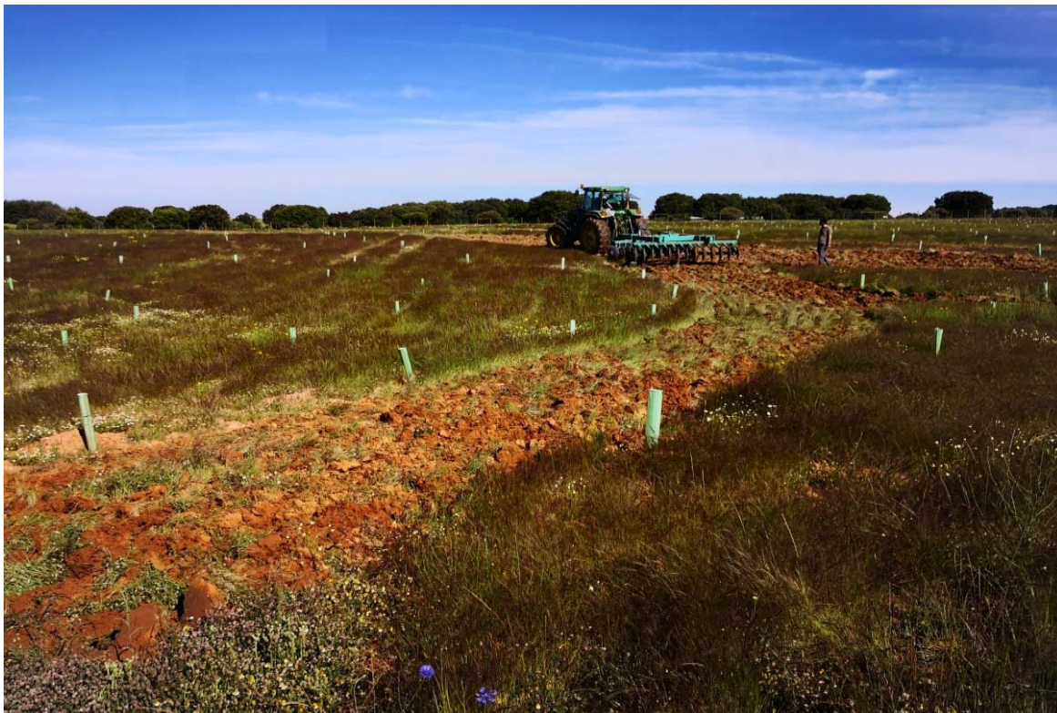
Imagen 6. Laboreo superficial con grada de discos

Se recomienda laborear con un cultivador o una pequeña grada de discos a no más de 15 cm de profundidad en las zonas donde no existen “quemados” y 10 cm en las zonas con “quemados”.