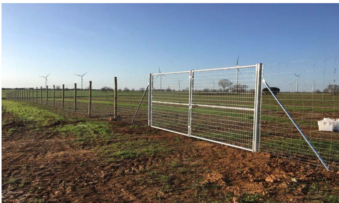
Imagen 5. Detalle de vallado en plantación trufera en Ampudia (Palencia).

El cerramiento debe cumplir el objetivo principal de preservar la plantación trufera, por ello deberá adaptarse a la fauna existente y a los condicionantes de la zona que nos haga elegir un tipo de cierre sobre otro. Existen numerosos tipos de vallado, dentro de los cuales se hace necesario optar por una serie de parámetros, como son la altura (1,5- 2,5 m) y los materiales que la formen (resistentes y duraderos en el tiempo).